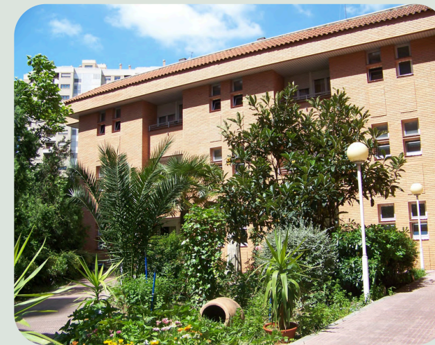
NUESTRA SEÑORA DEL CARMEN