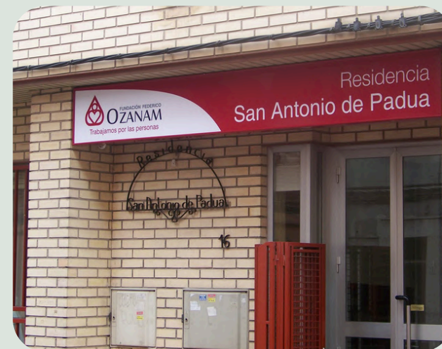
SAN ANTONIO DE PADUA