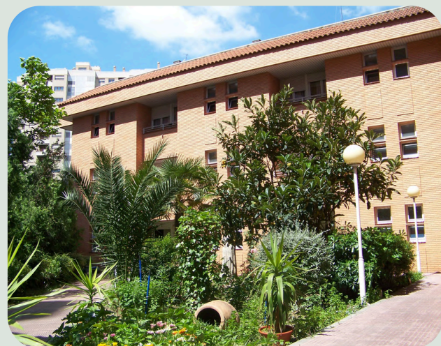
NUESTRA SEÑORA DEL CARMEN