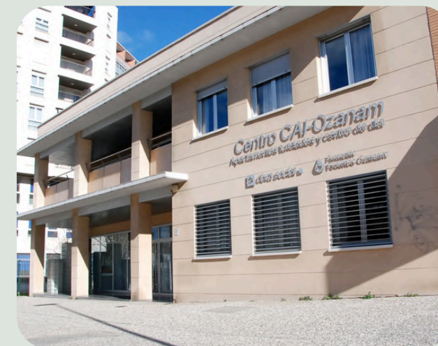
APARTAMENTOS TUTELADOS POMARÓN